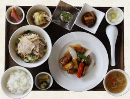
健民式焼米粉ランチ 1800