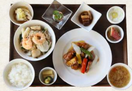
海鮮焼米粉ランチ 2400