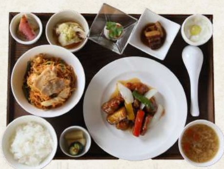
ピリ辛焼米粉ランチ 1900