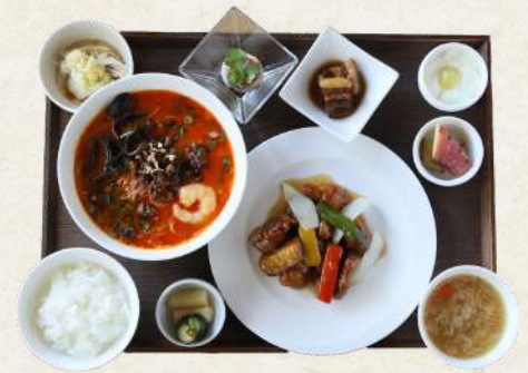
ピリ辛汁米粉ランチ 2100