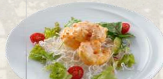
大海老のマヨネーズ