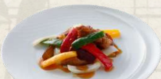
神戸ポークの酢豚