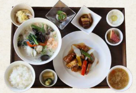
海鮮五目汁米粉ランチ 2100