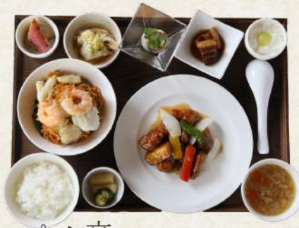
ピリ辛海鮮焼米粉ランチ 2500