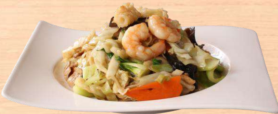
やわらかい焼そば