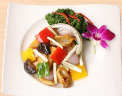
鮑のオイスターソース炒め