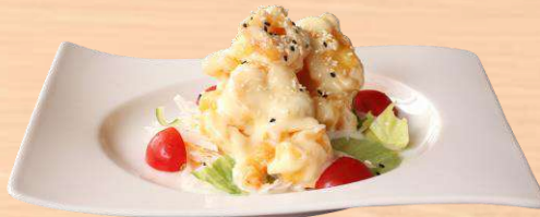
海老のマヨネーズ和え