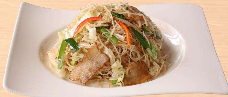
福建風五目焼ビーフン