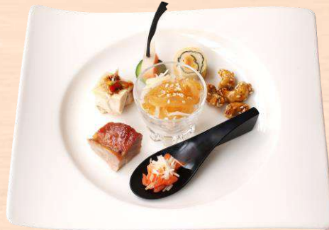
料理長特製前菜盛合せ