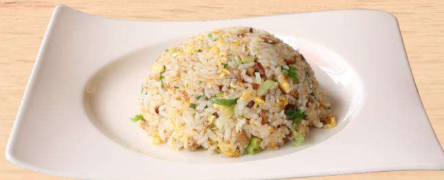
チャーシュー炒飯