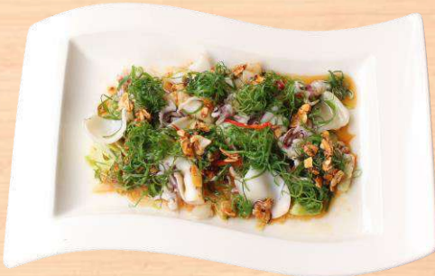
ヤリイカの葱ソース和え