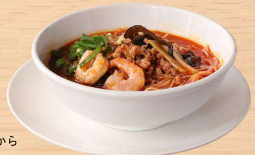
ピリ辛汁ビーフン