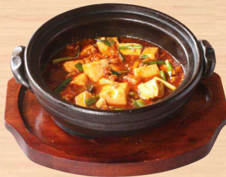
麻婆豆腐 土鍋仕立て