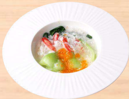
チンゲン菜の蟹身あんかけ