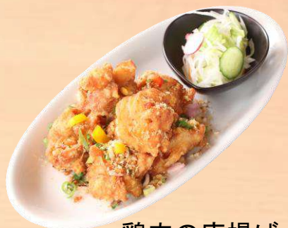
鶏肉の唐揚げ ガーリック風味