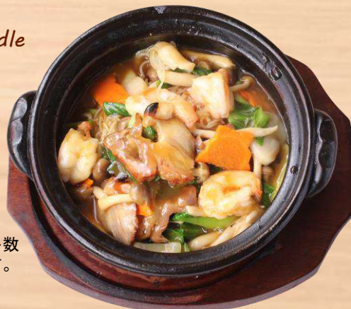
特製土鍋焼ビーフン