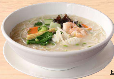
海鮮五目汁ビーフン