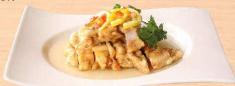
鶏肉の唐揚げ レモンソース