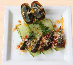
ピータン(黒い玉子)