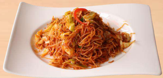
ピリ辛焼ビーフン