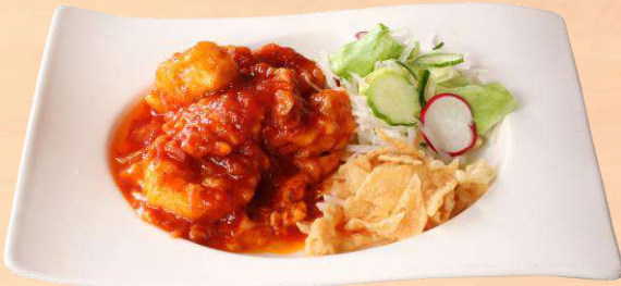
海老のチリソース煮