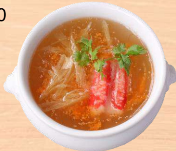
蟹肉入りフカヒレスープ