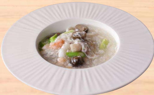
海鮮あんかけ炒飯