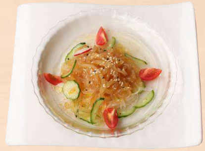
クラゲの甘酢和え