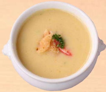
蟹肉入りコーンスープ