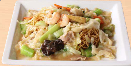
海鮮あんかけ揚げ焼そば