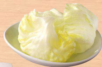
豚肉のレタス包み