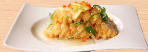
イカの巻揚げ レモンソース