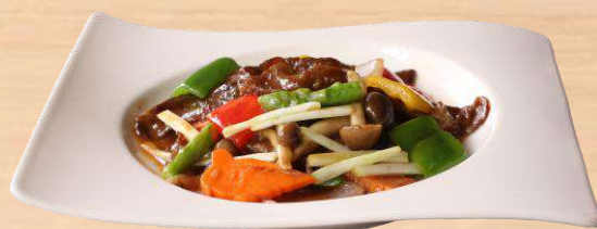
淡路牛の炒め XO醬 または 豆鼓ソース